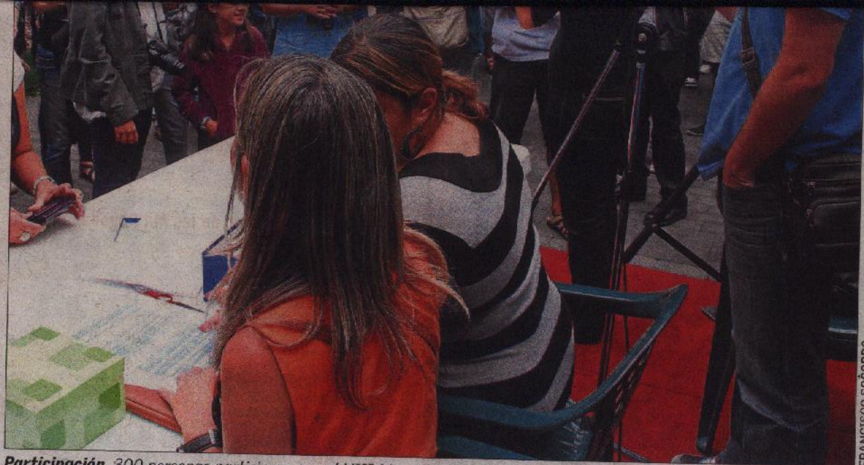
Participación. 300 personas participaron en el VIII Maratón Fotográfico de Mesa y López.

El maratón comenzó a las diez y media de la mañana -con puntualidad británica-. A esa hora se abrió el primer sobre, en el que se daba a conocer el primero de los seis temas sobre los que los participantes debían hacer las fotos. Tocó el agua. Y la gente se volvió loca creando charcos de cartulina, inmortalizando a limpiadoras, regando plantas con botellines de agua y así durante media hora. A las once una sirena anunciaba la apertura del segundo sobre con el siguiente tema a realizar en los siguientes treinta minutos: urbanismo y así sucesivamente hasta las 13.30 horas, cuando se dio por finalizado. Los siguientes temas fueron pies, deportes, autorretratos y dinero.